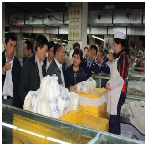
上级领导来水师营街道人和市场进行调研