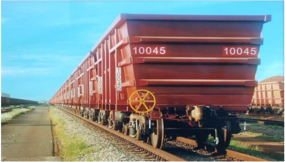
35.7 吨轴重力拓车矿石车