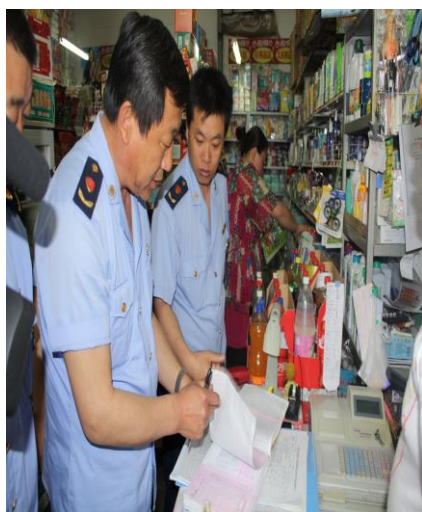
食品科检查中小校园周边流通环节食品安全