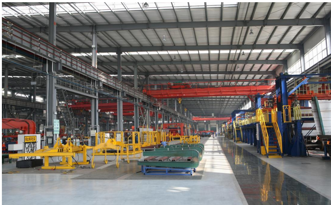
中国北车集团齐车公司铁路货车组装基地

■技术创新 2011年，全区工业企业开发新产品80项，新增产值60亿元，科技贡献率达到31%。完成技术改造项目备案15项，总投资额为2亿元。进一步加强企业研发中心建设，重点跟踪齐车、大机车国家级研发中心项目建设情况。5月8日，齐车轨道国家级研发中心正式挂牌，标志着全区在研发创新方面步入了国家领先水平。大机车研究所、北车研发中心项目进展顺利。进一步完善技术改造项目备案管理制度，通过现场考察、项目可行性综合评价等方式，对技改项目进行严格审查，同时积极做好项目改造的指导工作。协调解决了大连博瑞重工多年悬而未解的技改项目推进工作。