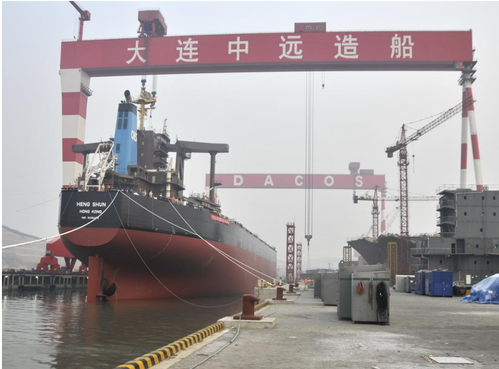
大连中远造船工业有限公司

■政策法规 为适应绿色经济区建设要求，加快推进产业结构优化升级，转变经济发展方式，进一步完善政策措施，2011年7月旅顺口区制定出台了《旅顺口区关于加快绿色工业经济发展的实施意见》（旅政发[2011]70号），这是本区近年来出台的政策力度最大、实施措施最全面的政府文件，为全区绿色工业经济发展发挥了良好的导向性作用，是当年和以后一段时期全区工业经济发展的纲领性文件。