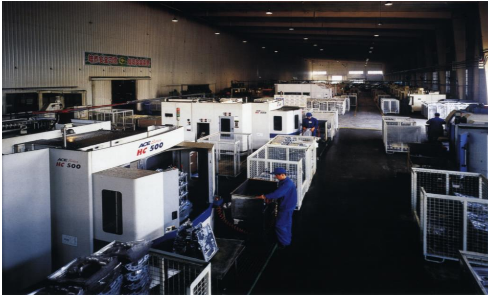
大连亚明汽车部件股份有限公司